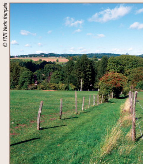
Prairies et pâtures

L'eau est omniprésente à Seraincourt. Le territoire de la commune a été façonné par trois cours d'eau qui ont creusé leurs vallées à travers le plateau calcaire du Vexin français. La Bernon dévale des coteaux de Montalet-le-Bois pour rejoindre la Montcient en plein cœur du village. La Montcient, après un parcours de 13 km le long duquel on comptait au XIX e siècle pas moins de 15 moulins, se jette dans l'Aubette de Meulan à quelques mètres seulement de la confluence avec la Seine. Le ru de l'Eau Brillante borde le hameau de Rueil jusqu'au centre-bourg, le séparant des vastes prairies et pâtures situées en fond de vallée. Les boisements sur les coteaux font la transition avec le plateau dominant, dédié à l'agriculture céréalière. Le tissu urbain est maintenant presque continu entre le bourg et le hameau de Rueil. C'est là que se concentrent les éléments les plus remarquables du patrimoine hydraulique de Seraincourt : le Vieux-Moulin et sa cascade, le lavoir communal et sa mare-abreuvoir, le Blanc-Moulin et ses hôtes illustres, les bassins des anciennes cressonnières reconvertis en étangs de pêche... content l'histoire de la commune dans un doux bruissement d'eau.